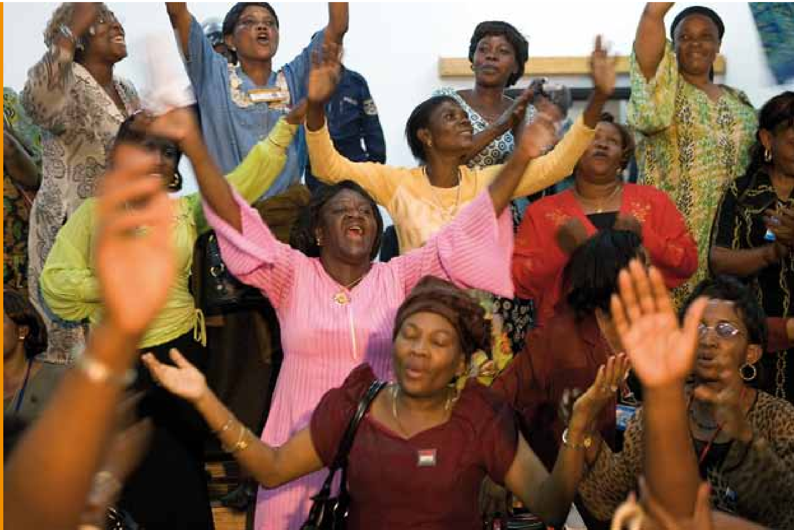
République démocratique du Congo, 2008: les représentantes de la société civile locale jubilent à la signature de l'accord de paix de Goma.