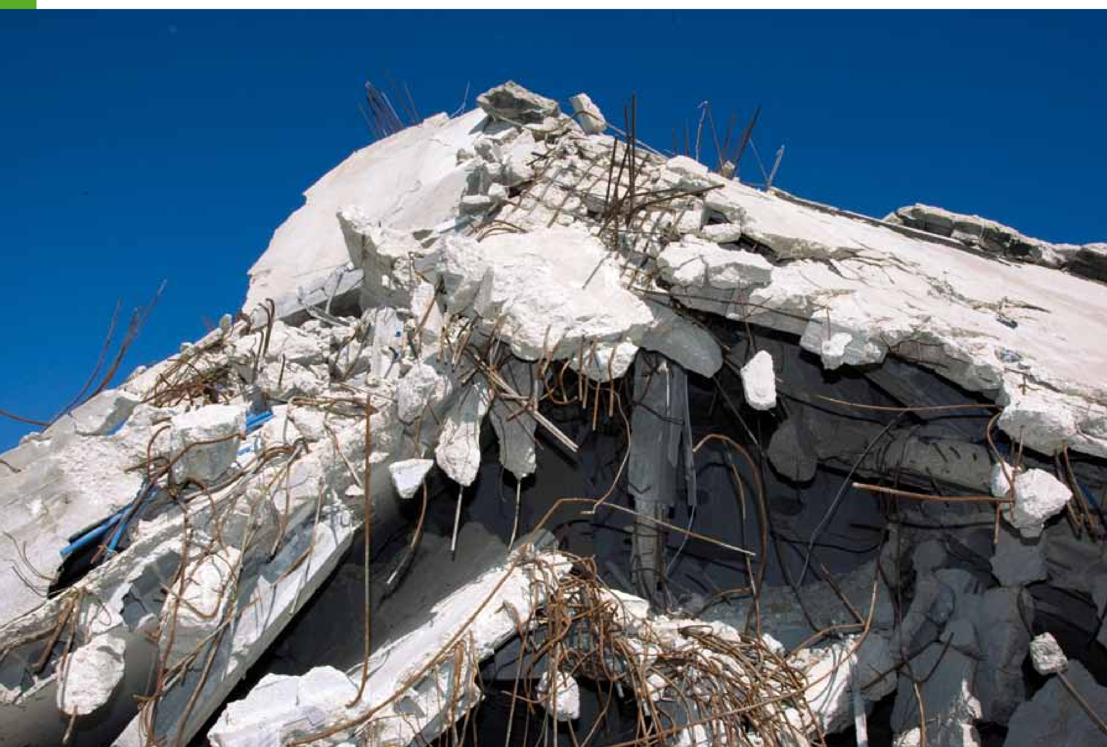
Bande de Gaza, 2010: les bâtiments détruits par l'armée israélienne fin 2008 lors du conflit à Gaza sont toujours en ruine. Tout comme le processus de paix au Moyen-Orient.

Inscription sur une banderole de Sumaya Farhat-Naser et Gila Svirsky , Jérusalem