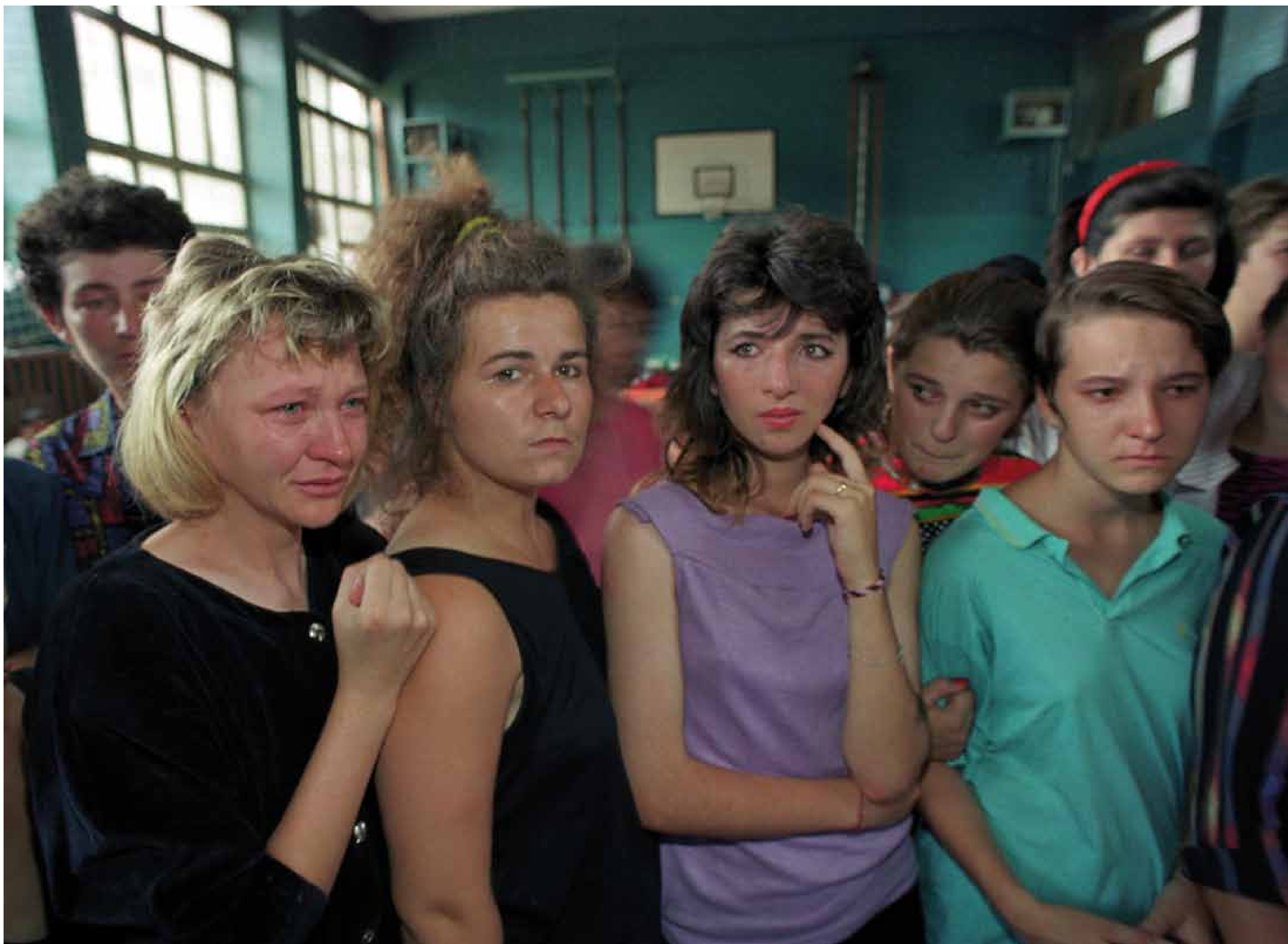
Bosnie, 1992: des femmes violées sont hébergées comme réfugiées dans une salle de gymnastique à Tuzla.