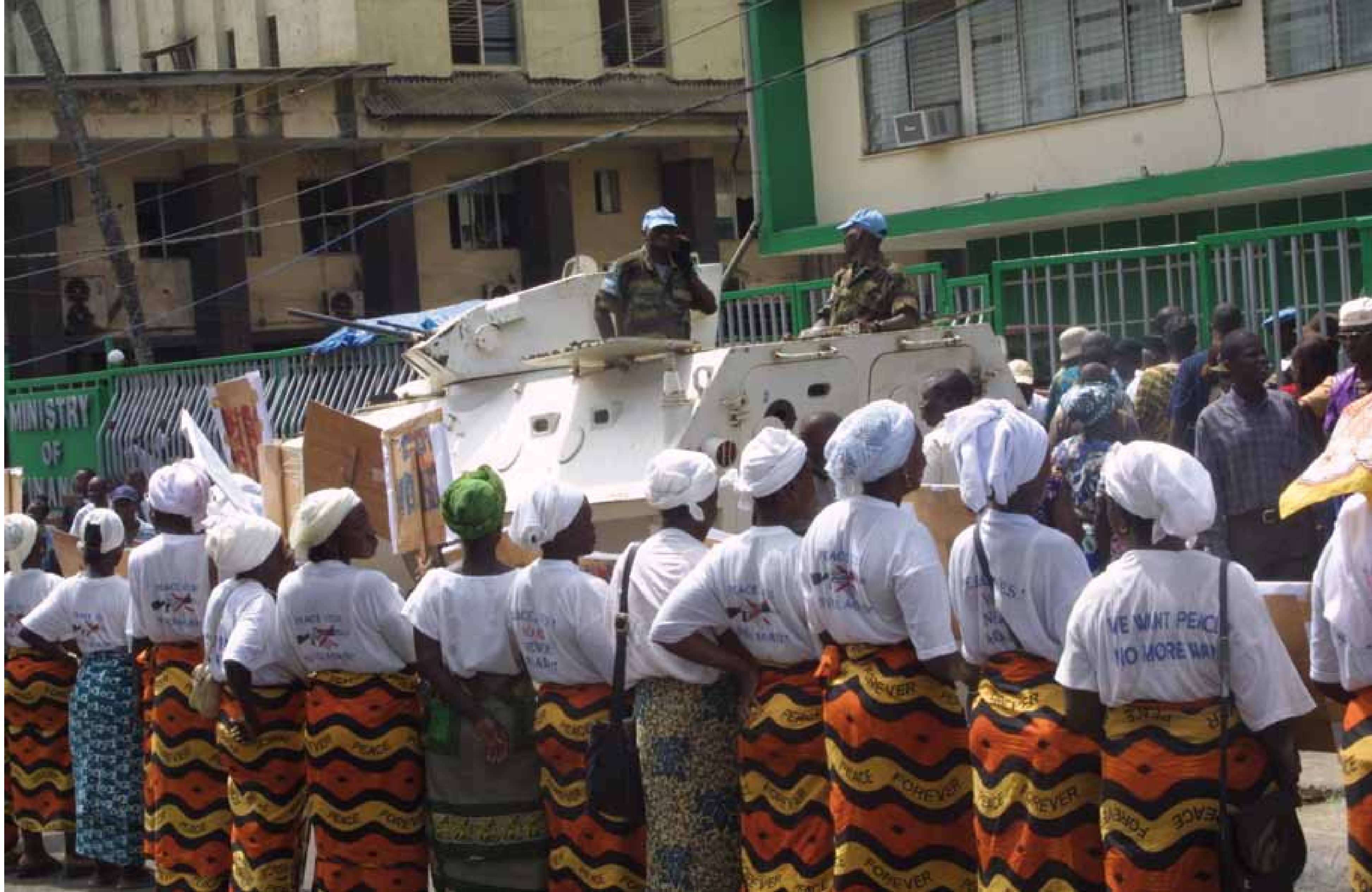
Libéria, 2004: les femmes traversent Monrovia une fois par semaine lors d'une marche pacifiste.