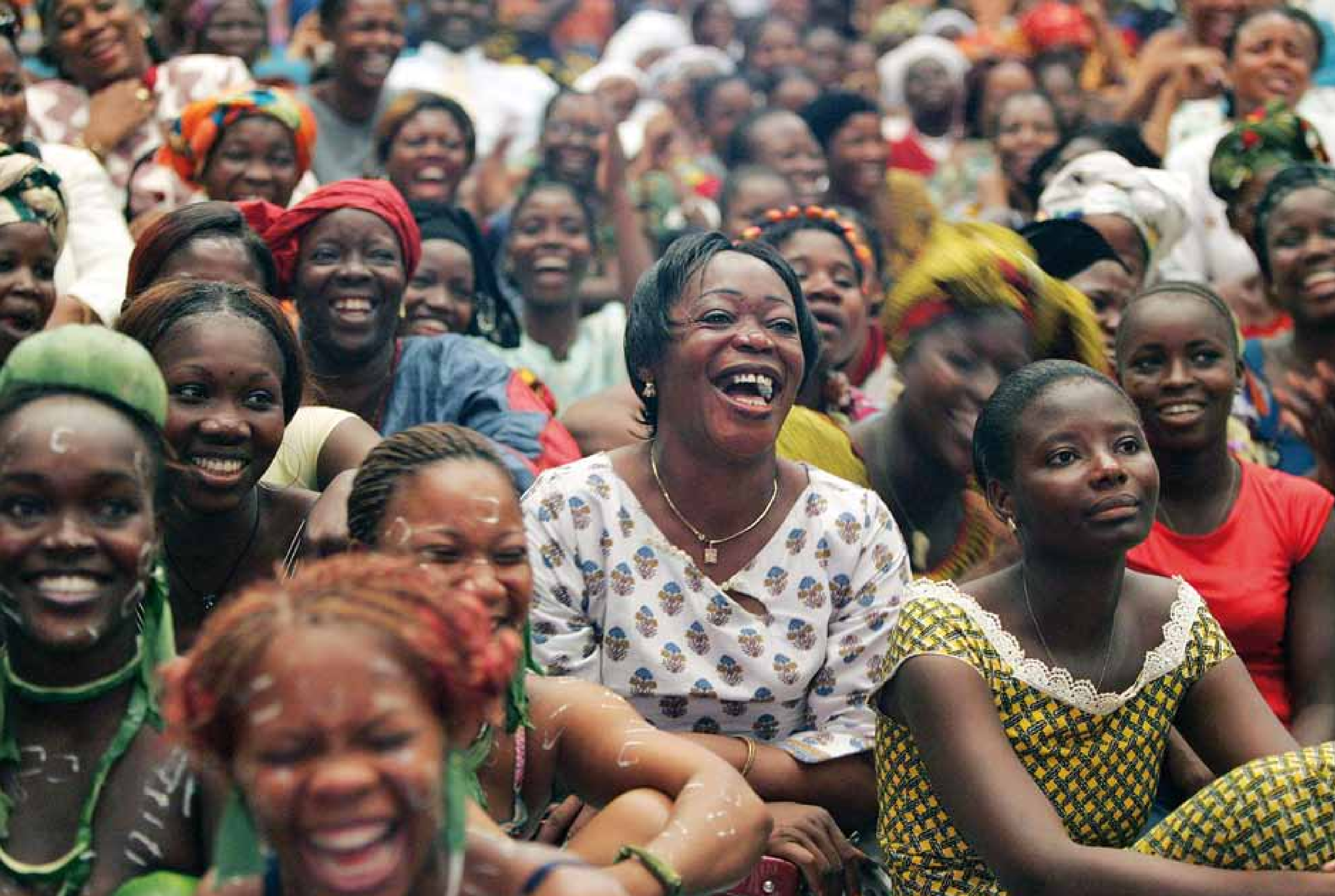
Côte d'Ivoire, 2005: les femmes célèbrent la journée internationale de la femme à Abidjan.